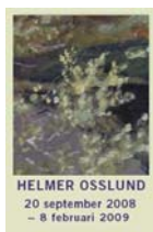
HELMER OSSLUND 20 september 2008 – 8 februari 2009

Varieté Kreisler, Stora scenen kl. 20.00